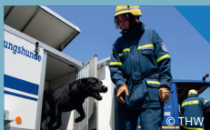
THW-Hundestaffel im Einsatz (Innenhof) um: 11:30, 14:00, 15:30, 17:00